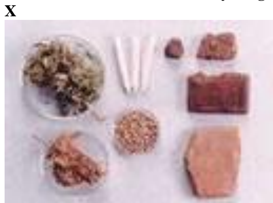
Obrázek nebo Obr. č. 1 - Druhy drog (velikost 12 tučně)

X Zdroj: https://www.osmeta.cz/primarni_prevence/druhy_drog/ (velikost 12 kurzíva)